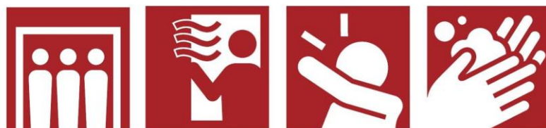
密閉回避 換気 咳エチケット 手洗い